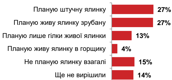
Рис 3. Розподіл відповідей на запитання «ЯКУ ЯЛИНКУ ВИ ПЛАНУЄТЕ СТАВИТИ, ЯКЩО ПЛАНУЄТЕ?» (можливо кілька варіантів відповідей)

Найбільш популярними різдвяно-новорічними прикрасами оселі є ялинки штучні та живі (по 27% відповідей). 13% опитаних планують використовувати ялинкові гілочки, переважно це люди пенсійного віку. Живі дерева у горщиках прикрашають 4% респондентів. Загалом майже 70% українців планують створювати святковий настрій за допомогою ялинок чи гілочок.