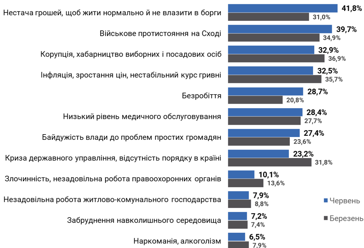
Рис.1. Розподіл відповідей на запитання: Я зачитаю перелік проблем, які зараз непокоять людей. Зазначте, будь ласка, три з них, які зараз особисто вас турбують найбільше (n=1000)

Найбільшу довіру серед політичних діячів має Президент Володимир Зеленський – йому довіряє 42,4% українців, але не довіряють 45,1%, тоді як ще на початку року баланс довіри був позитивним. На другому місці Дмитро Разумков, його рейтинг довіри – 25,1%. Третє місце поділяють Святослав Вакарчук та Юрій Бойко – по 20,8% українців повністю або скоріше довіряють цим політикам. Прикметно, що складання мандату не знизило, а навіть навпаки підвищило довіру до С. Вакарчука, в січні-березні йому довіряли 12%-19%. Володимир Гройсману та Ігорю Смешко довіряють по 18,3% опитаних. Найнижчою серед запропонованого переліку діячів є довіра до Арсена Авакова (9,8%), Олександра Вілкула (9,4%) та Дениса Шмигала (8,2%).